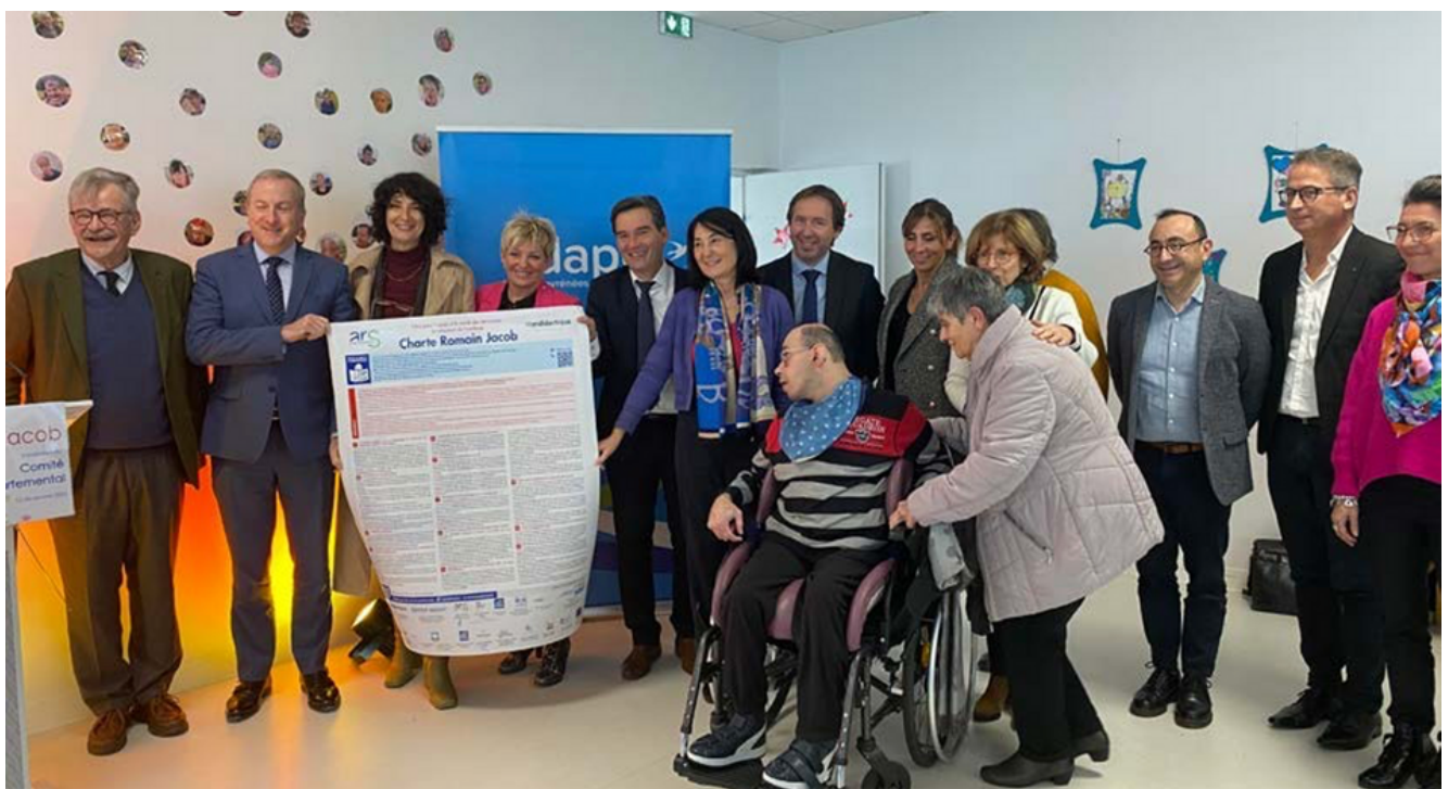
Comité départemental de la Charte Romain Jacob des Hautes Pyrénées (15 décembre 2023)