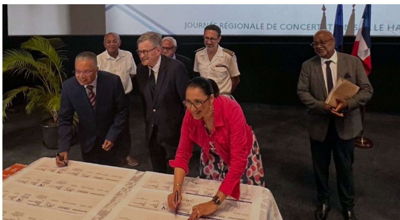
CNR de la Réunion (9 novembre 2023)